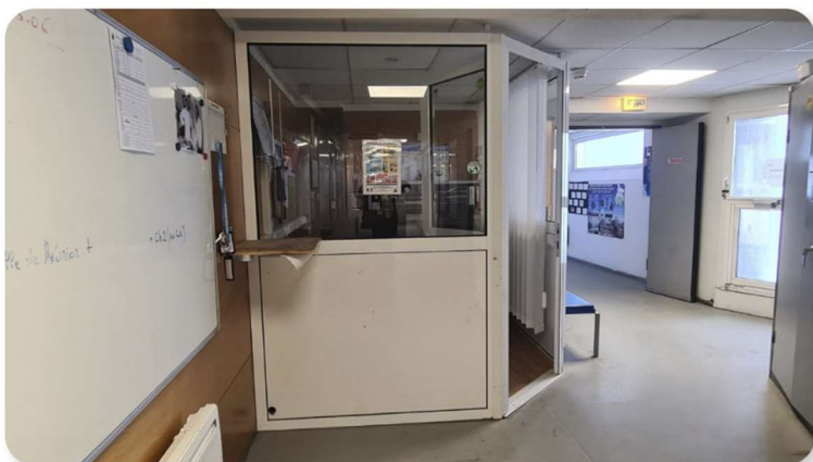
Accueil OMP AKA "La Guittoune"

En cas de besoin technique durant votre mission, vous pouvez joindre l'équipe OMP au 06 19 70 01 50 ou vous rendre directement à l' accueil OMP , situé deux portes sécurisées plus loin dans le couloir, à proximité du coronographe.